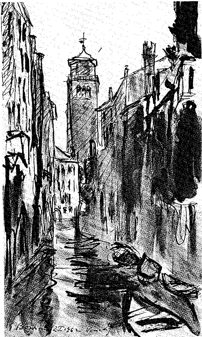
Erwin Bowien: Venedig, 1962, lavierte Federzeichnung.

Als der junge Erwin Bowien im schweizerischen Neuchâtel das College Latin besuchte und sich seine Berufung zum Künstlertum bereits deutlich abzuzeichnen begann, wurde er stark von der schweizerischen Künstlerfamilie Robert, insbesondere von Paul Robert (1852–1932) beeinflusst und begeistert, von dem wundervolle Bilder im Museum